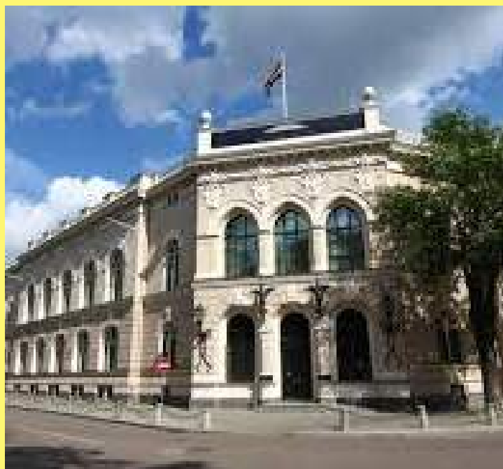
Latvijas Bankas ēka Rīgā.

Ja tava sapņu darba vieta ir banka, tad pēc 9. klases droši vari doties uz kādu no profesionālajām skolām, kur var apgūt grāmatveža vai klientu apkalpošanas speciālista profesiju. Ja sevi jau pozitīvi pierādīsi prakses laikā, iespējams jau skolas laikā varēsi uzsākt darbu bankā. Līdz ar to sākot savu virzību pa karjeras kāpnēm. Vai arī pabeidzot 12. klasi stājies ekonomistos. Daudzi darbinieki savu darbu bankā ir sākuši kā klientu konsultanti, bez iepriekšējām zināšanām un bez atbilstošas profesijas. Svarīgākais ir, lai tu proti sarunāties ar klientu, proti rīkoties ar datoru un lai tev ir labas svešvalodas zināšanas. Viss pārējais jau sakārtosies pēc tam. Galvenais ir ķert mirkli un savas dzīves iespējas. Bieži, kad mums veicas sakām, ka tā ir veiksmē, patiesībā tā ir vairāku veiksmīgu lietu sakritība. Varbūt nejauši satiekot svešu cilvēku un viņam pastāstot par saviem sapņiem, mēs varam izvilkt savu veiksmes lozi.